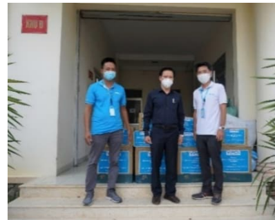
Lãnh đạo chính quyền thị xã Ninh Hòa tiếp nhận gói hỗ trợ thiết bị, vật tư y tế từ VPCL

VPCL cũng hỗ trợ bằng hiện vật các gói thiết bị vật tư y tế cho lực lượng tuyến đầu phòng, chống dịch Covid-19. Các gói hỗ trợ này đã được bàn giao cho UBND và Công an thị xã Ninh Hòa, UBND các xã Ninh Phước và Ninh Thọ.