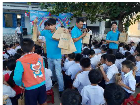
Trao 600 phần quà cho học sinh trường Tiểu học Ninh Phước nhân ngày Quốc tế Thiếu nhi 1/6.

Các hoạt động từ thiện đa dạng nhằm đóng góp cho sự phát triển của cộng đồng địa phương xã Ninh Phước.