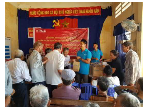
Trao tặng quà cho các cụ trên 70 tuổi thuộc các hộ gia đình bị thu hồi đất nhân ngày truyền thống Người cao tuổi.